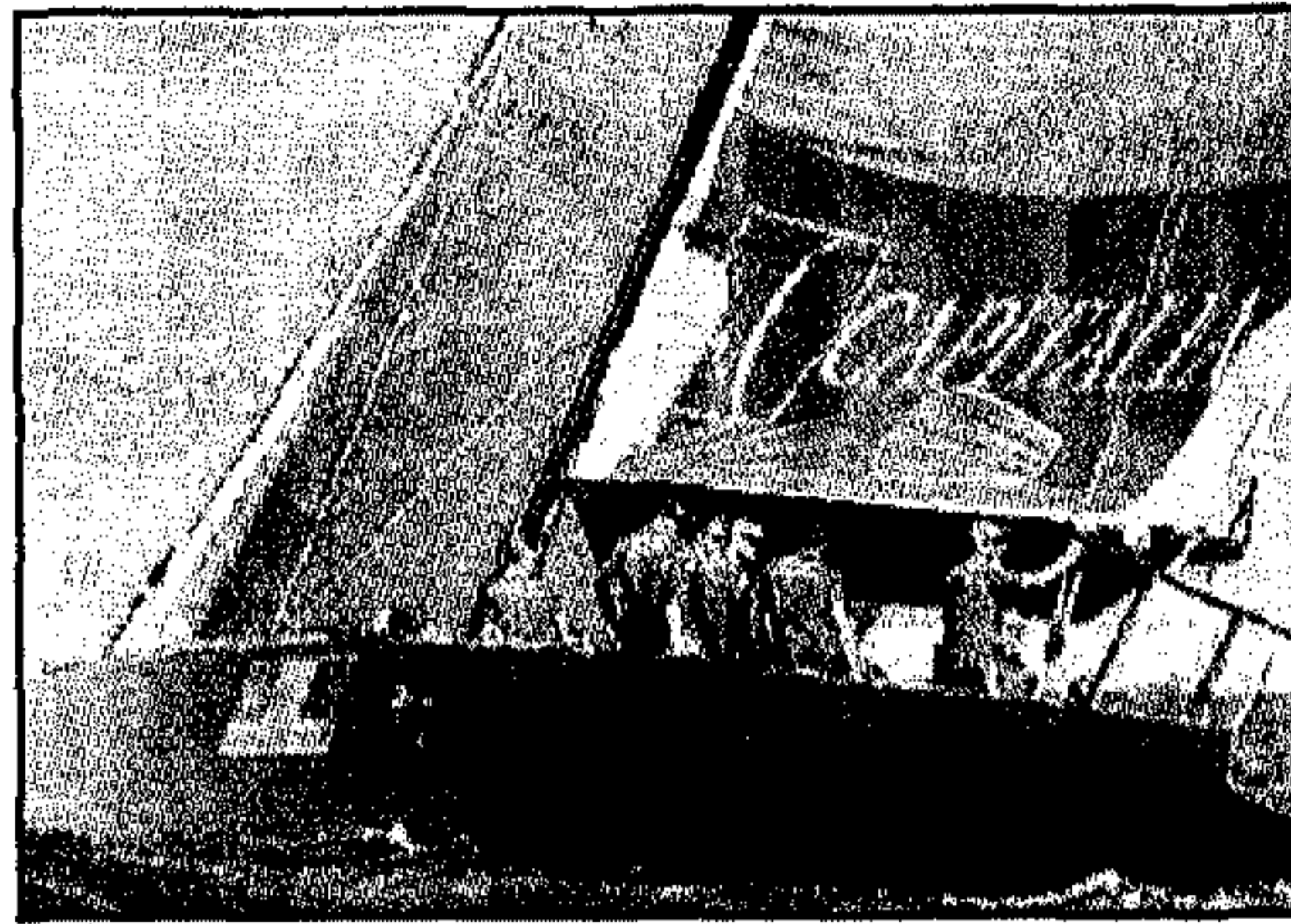
Mascalzone Latino-Capitalia, il team napoletano di Onorato, è 6° nella classifica degli Act 2005